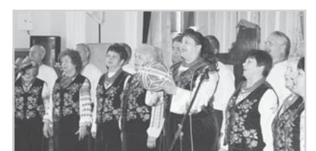
З великодніми гаївками фольклорно-етнографічний колектив «Доленька» Калуського палацу культури «Мінерал»