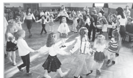
Вихованці дитячого садка «Пізнайко» на великодніх забавах

У Провідну неділю в ОНД «Просвіта» булолюдно і святочно. Молоді, а то й зовсім юні просвітяни, статечні пані та панове у вишиванках та охайних одяганках зійшлися на традиційні великодні забави у «Просвіті». «Христос воскрес! Радійте люди!» Авансцена, як і зала, прибрана рушниками, чути далеко відлуння дзвонів, які сповіщають про початок дійства.