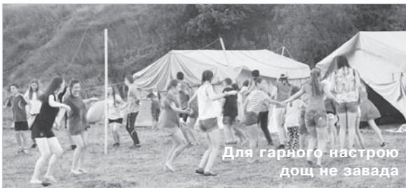
Для гарного настрою дощ не завада

З неба падав сліпий теплий літній дощ, а на березі Дністра лунала гучна музика. Серед розкинутих же наметів, зібравшись у велике коло десь із півсотні дівчаток і хлопців весело танцювали королівський банс. Інші у наметах просто від-