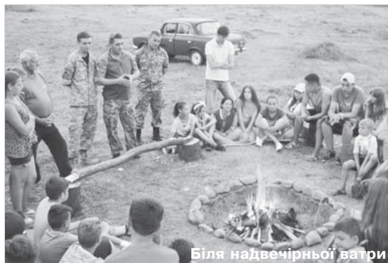
Біля надвечірньої ватри

Зумисно так детально описуємо ситуацію, щоб зрозуміти, як багато потрібно виконати організаційних справ, залучити людей, аби здійснити задуману